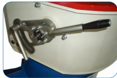
Manual Flap Control Manuel Rampa Kontrol