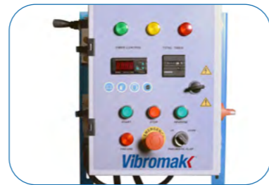
Electric Control Panel Elektrik Panosu