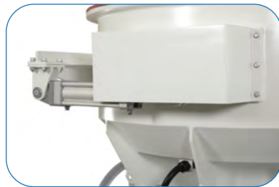
Pneumatic Flap Control (Optional) Pnömatik Sistem Rampa Kontrol